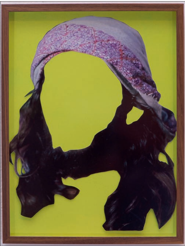
SIMON MENNER: TERROR KOMPLEX, 2016