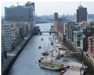
Der Ausblick der siebenköpfige Jury im