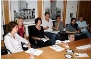
Wenn es eng wird - am Ende - rücken alle zusammen