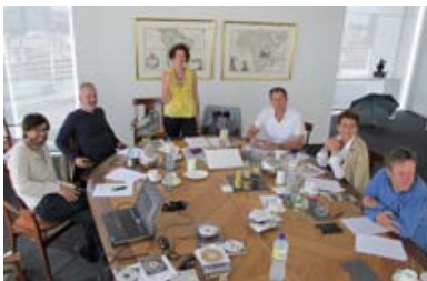
Die sechsköpfige Jury im Jahr 2012 bei der Arbeit ...