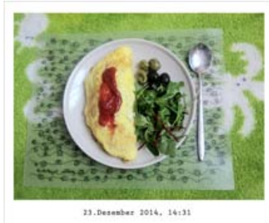
23. Dezember 2014, 14:31 ... einjähriger Nahrungsaufnahme