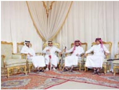
Zwischen gestern und morgen, nur nicht heute: Gregor Schmidts Bilder des Ölstaates - Waiting for Qatar