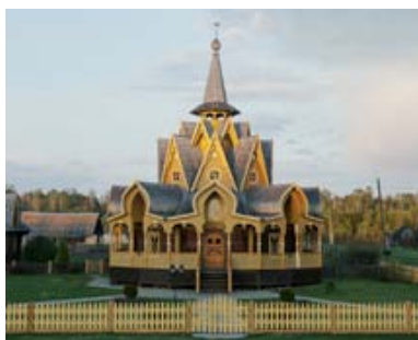
Once Upon a Time in the East: Jewgeni Roppels komplexe Serie Magnit

Menge über Hyuns Tun und Lassen, ihre Aufenthaltsorte und Gepflogenheiten – Social Media an der Wand. Über das oberflächliche Spaß-Bild auf Facebook & Co landen wir unerwartet in einer soziokulturellen Betrachtung über die Rituale einer digitalen Gesellschaft, deren echtes Leben zunehmend in einen virtuellen Orbit verlagert wird. Genussreiches Speisen degeneriert zur "Nahrungsaufnahme" und ist ebenso flüchtig wie das Erstellen und Konsumieren von Fotos ... alles mit einem Klick jederzeit verfügbar.