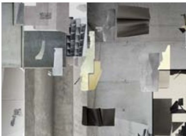
Der Raum im Bild und das Bild im Raum: Maja Wirkus raumgreifende Arbeit Praesens II Präsens