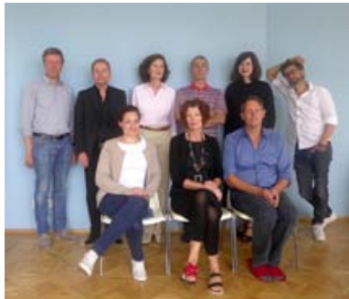
Die gute aussichten 2015/2016 Jury ...

Wir alle kennen sie, jene Vision einer zukünftigen Welt, die der britische Schriftsteller Aldous Huxley 1932 unter dem Titel "Brave New World" publizierte: Alle Menschen leben, gentechnisch manipuliert, zufrieden und glücklich als "Alpha-Plus-" oder "Epsilon-Minus"-Tierchen in einer festgelegten Hierarchie und in einem gesicherten Rahmen, dessen Regeln von allen unabdingbar einzuhalten sind. Überwachung ist allgegenwärtig und reicht bis in die intimsten Sphären eines jeden Lebens. Als Belohnung für Bspitzelung und autoritäre Bevormundung winkt grenzenloser Konsum. Und die Droge "Soma" versüßt all das, was verschwunden ist aus dieser schönen, neuen Welt.