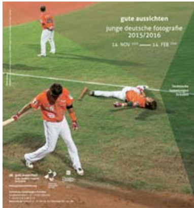
gute aussichten 2015/2016, 13.11.2015 - 14.2.2016 in den Technischen Sammlungen Dresden

Neustadt/Weinstrasse, Dienstag, den 27. Oktober 2015