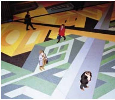
Schöne, neue Welt? Von wegen! Aras Gökten entnimmt seine Bilder ...