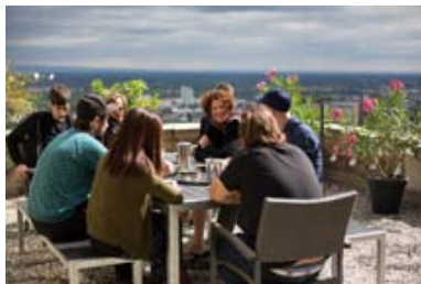
... Treffen der neun gute aussichten Preisträger in Neustadt/W.

Seit Beginn des 20. Jahrhunderts ist die Technik der primäre und stärkste Taktgeber für industriellen und gesellschaftlichen Wandel. "Die Grenzen des Wachstums", wie sie bereits in den siebziger Jahren des vorigen Jahrhunderts lebhaft diskutiert wurden, sind dabei längst überschritten worden. Die Fakten und Herausforderungen, denen sich die heutige und zukünftige Generationen stellen müssen, sind: Migration, Klimawandel, Globalisierung, eine wachsende Weltbevölkerung bei ungleicher Verteilung von Nahrung und Gütern, die maximale Ausnutzung aller Ressourcen, der Kampf um Rohstoffe und geopolitische Einflussnahme. Die zukünftige "Reiseroute" ist dabei alles andere als linear und vorhersehbar. Der große Plan scheint noch in weiter Ferne und es stellt sich bei allem Fortschritt die Frage nach Ethik und Moral und ob das Mögliche der Welt auch wirklich dient und sie es braucht.