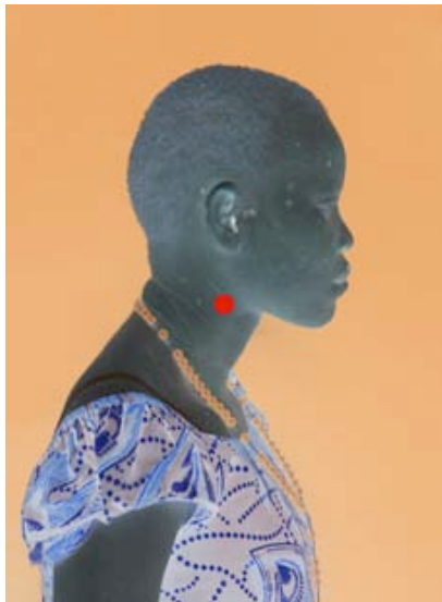
MA_Bild_002.jpg