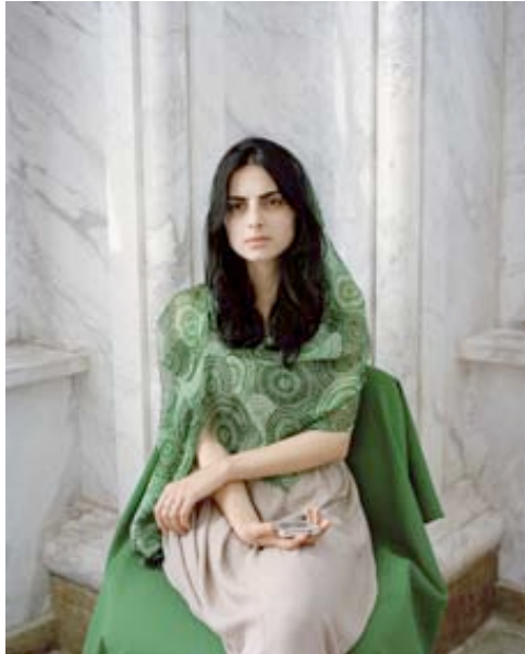
21_CC_Grüne_Frau_01.jpg