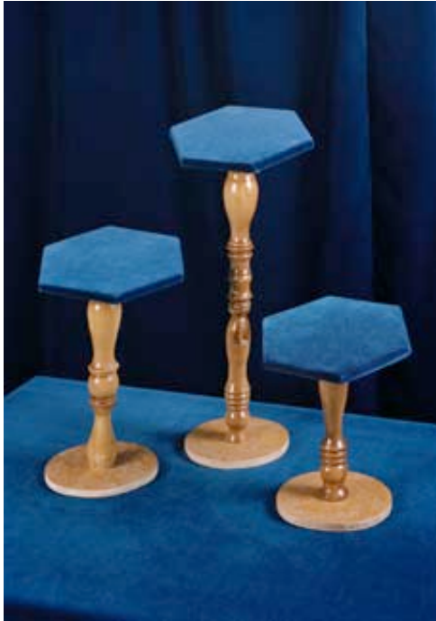
29_CC_3_Hocker_01.jpg

Hand und Kerze, 2016, 1 C-Print, 30 x 24 cm, gerahmt in lackiertem Holz