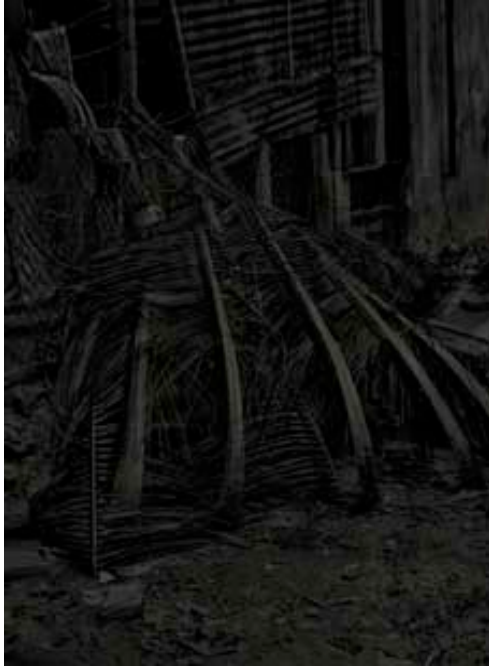
QV_TENEBRAE_06.jpg