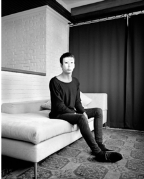
CB_Bild_015.jpg